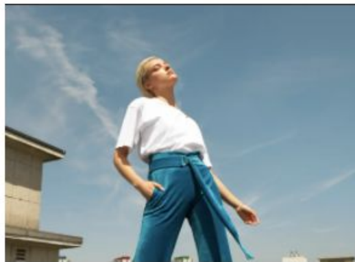
Go As UR